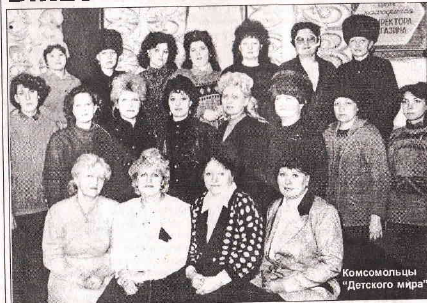
Комсомольцы "Детского мира".

Комсомольцы проявляли мужество и героизм на стройках пятилетки, на промышленных предприятиях. Мы же, комсомольцы и молодёжь орс промышленных товаров, выполняли скромную роль, реализуя товары народного потребления труженикам города. Но так же стоимлись быть в первых рядах строителей новой, лучшей жизни.